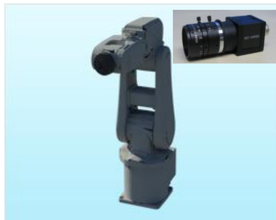
ロボットビジョン用照明